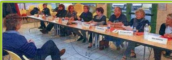
Cette semaine, après deux ans d'existence, les responsables du Syndicat autonome de la fonction publique territoriale ont tenu leur première réunion d'information.

Assemblée générale ordinaire annuelle de l'Union Départementale du Var, qui a eu lieu le mercredi 17 novembre 2010 à CUERS (Var).