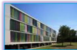
COMMUNAUTÉ D'AGGLOMÉRATION DU GRAND AVIGNON - COGA