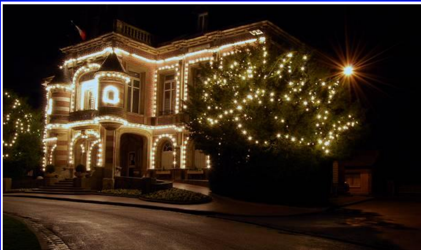
Photo de couverture : Mairie de Bois Guillaume (Haute Normandie -76)

Edition du S.A.F.P.T. N° 57 - Novembre / Décembre 2010